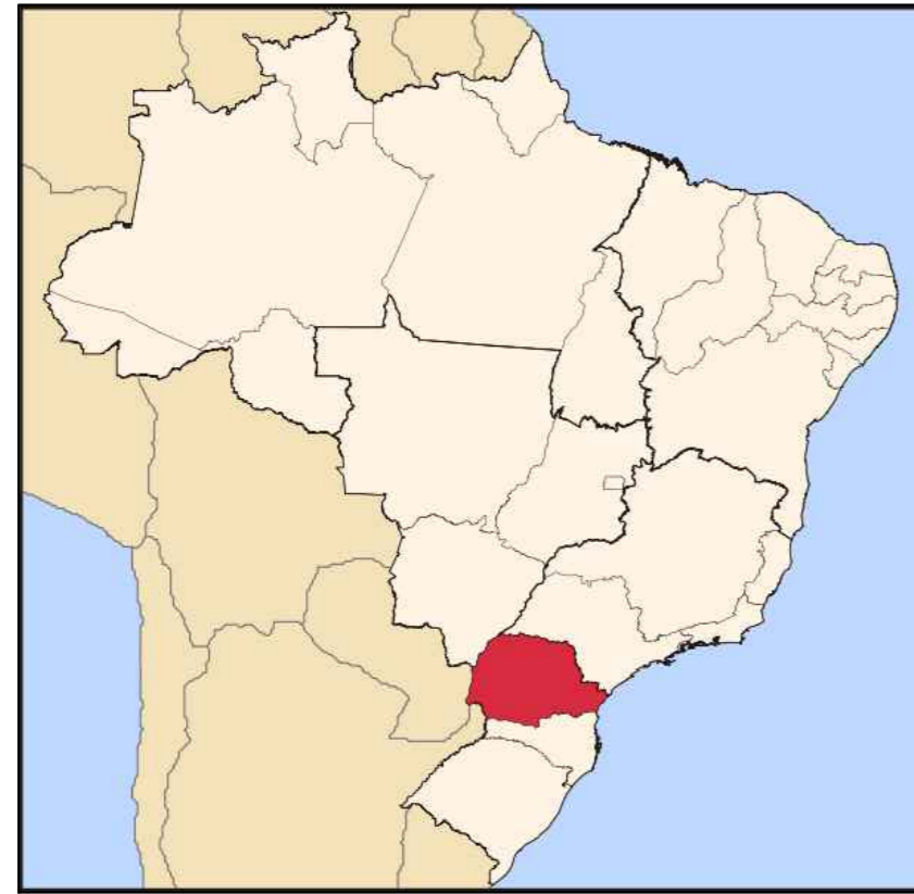
LOCALIZAÇÃO DO ESTADO SEM ESCALA