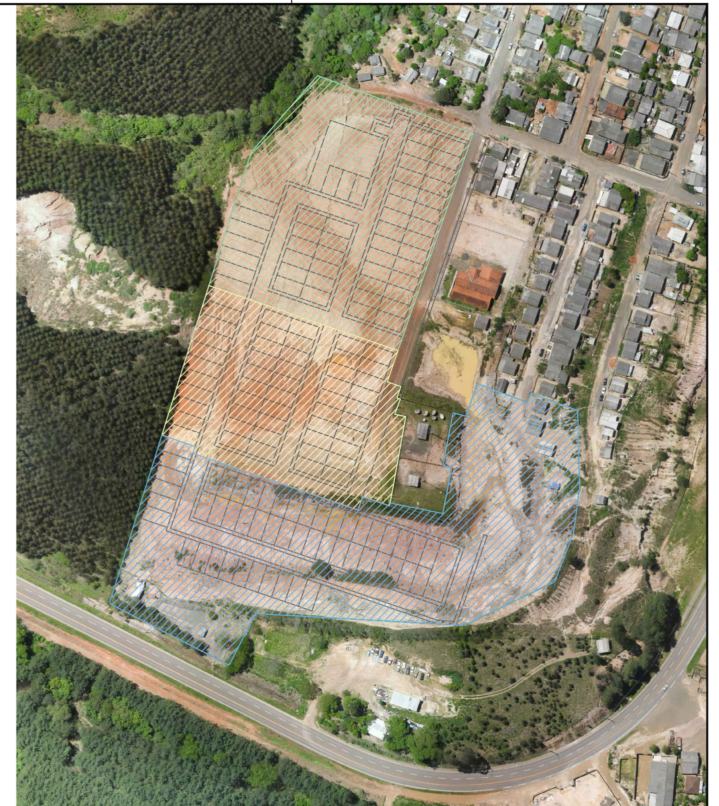
PLANTA DE LOCALIZAÇÃO - LOTEAMENTO SÃO JOSÉ Esc: 1/1500