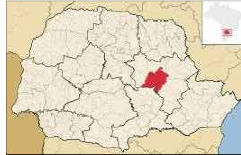
LOCALIZAÇÃO DO MUNICÍPIO SEM ESCALA